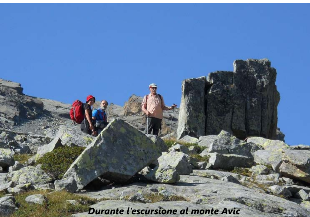
Durante l'escursione al monte Avic

Proprio l'amicizia e la frequentazione nata in quegli anni (in verità eravamo anche colleghi di Corso di Laurea, anche se di Dipartimenti diversi: lui di Geologia ed io di Ma-