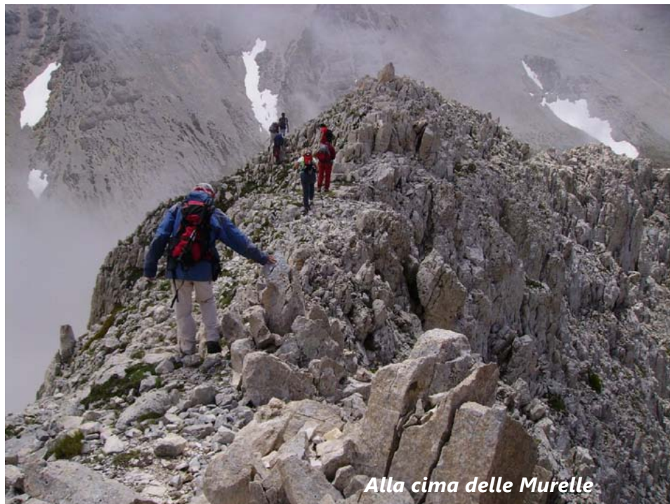
Alla cima delle Murelle

Devo anche citare il fatto che, dopo aver curato nel 1994 il volume 7 delle Guide Geologiche Regionali (edito dalla BE-MA per la Società Geologica Italiana), dedicato all'Appennino Umbro-Marchigiano, nel 2001, insieme a G. Ciarapica, volle aggiungere e curarne una seconda parte con 34 itinerari a piedi; si tratta di un vero e proprio interessante libro di escursionismo, naturalmente finalizzato ad osser-