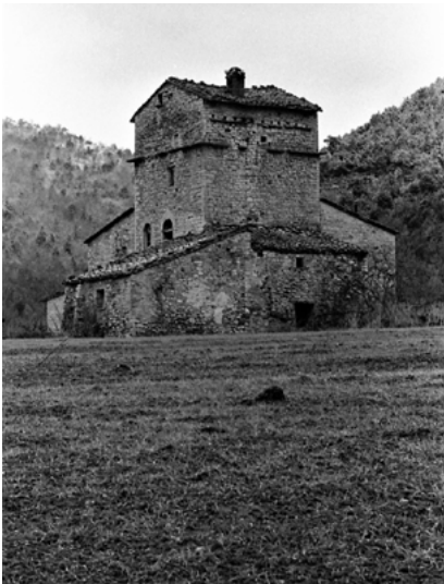
Questa foto BN è degli anni '70 del secolo scorso, quando la Casa non era ancora coperta di rovi.