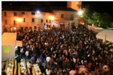
La piazza gremita di "degustatori"

caratteristiche di semplicità e genuinità di un tempo. I "pici" sono sempre gli stessi, fatti rigorosamente a mano dalle donne del paese, i sughi al ragù e all'aglione sono preparati con la stessa meticolosa cura delle nostre nonne, i vini sono quelli generosi e genuini delle campagne senesi. Oltre il concerto della Banda c'è la musica da ballo per giovani e meno giovani. Un'organizzazione complessa frutto della partecipazione disinteressata della gente di Celle che per giorni, messe da parte le proprie attività, lavora perché tutto funzioni al meglio. E nemmeno le finalità della festa sono cambiate. Rimangono validi anche oggi i motivi che la fecero nascere. Rivitalizzare il paese puntando sul suo senso comunitario e sulle tradizioni (un'intuizione anticipatrice di mode che verranno molto più tardi), e mantenere in vita la Società Filarmonica. Obiettivi centrati entrambi perché ancora oggi si deve al volontariato dei cellesi se si riesce a organizzare una festa che richiama tanta gente dalle regioni e dai paesi vicini, da Firenze, da Roma. Ed è solo grazie alla Sagra se la Banda continua a trasmettere la cultura musicale e accompagna con le sue note tutte le feste del paese.